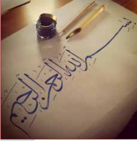
Rahman ve Rahim Allah'ın adıyla...

M uhterem üye, gönüllü ve dostlarımız; şu an işinizi gücünüzü bırakıp İLKDER'in bültenini elinize aldınız. Uzunca bir süredir İLKDER olarak sizlerle birlikte olmadık ve İLKDER'in rutin çalışmalarından sizleri haberdar edemedik. Bunun bir çok nedeni vardı. Birincisi belki de en önemlisi ekonomik sıkıntı. Evet uzunca bir süreden sonra tekrar elinizde 28. Sayımızla birlikte sizleri yazılı olarak çalışmalarımızdan az da olsa bilgilendireceğiz.