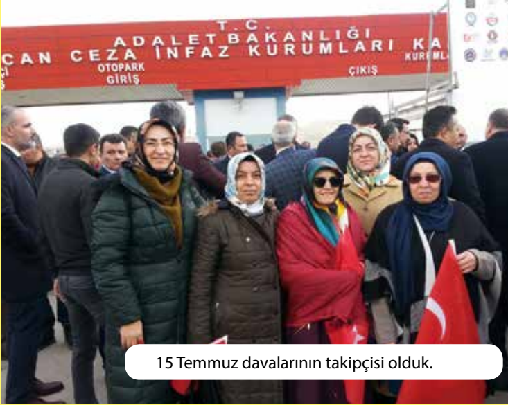
15 Temmuz davalarının takipçisi olduk.