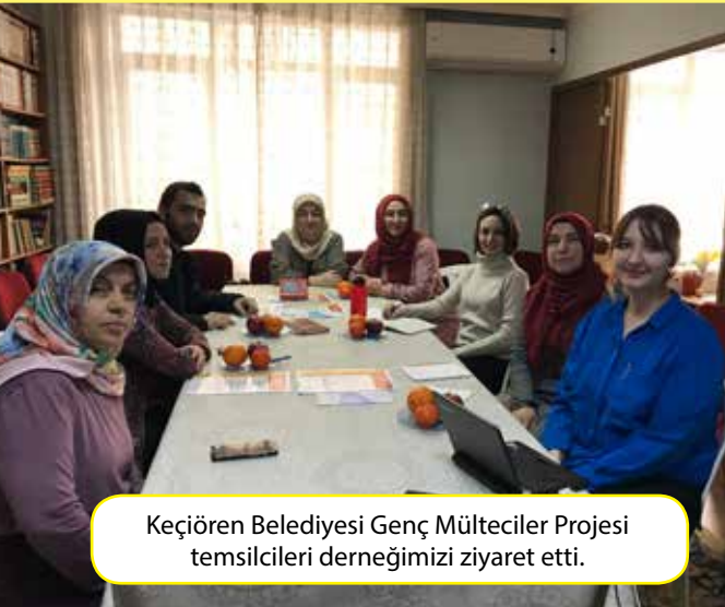
Keçiören Belediyesi Genç Mülteciler Projesi temsilcileri derneğimizi ziyaret etti.