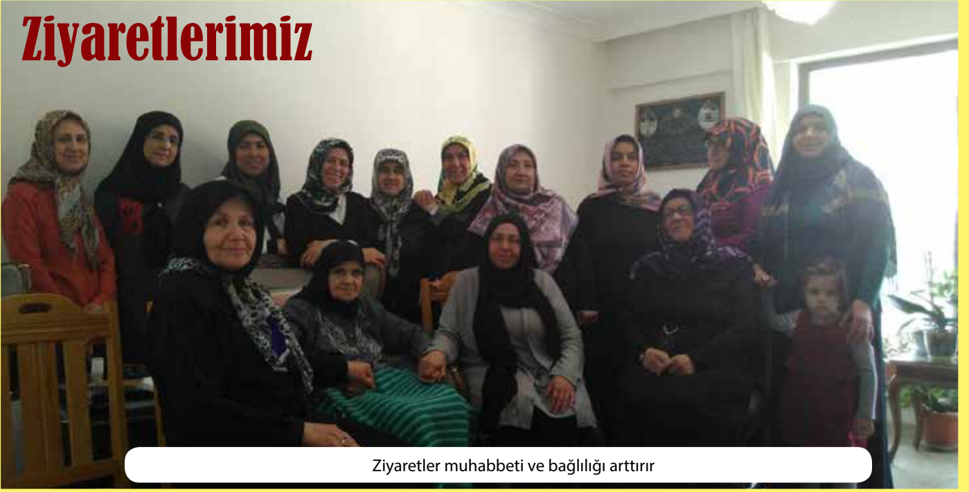
Ziyaretler muhabbeti ve baęlılıęı arttırır