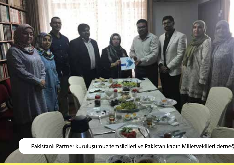
Pakistanlı Partner kuruluşumuz temsilcileri ve Pakistan kadın Milletvekilleri derneğimizi ziyaret ettiler.