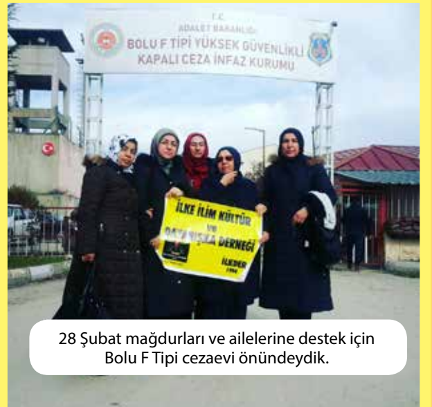
28 Şubat mağdurları ve ailelerine destek için Bolu F Tipi cezaevi önündeydik.