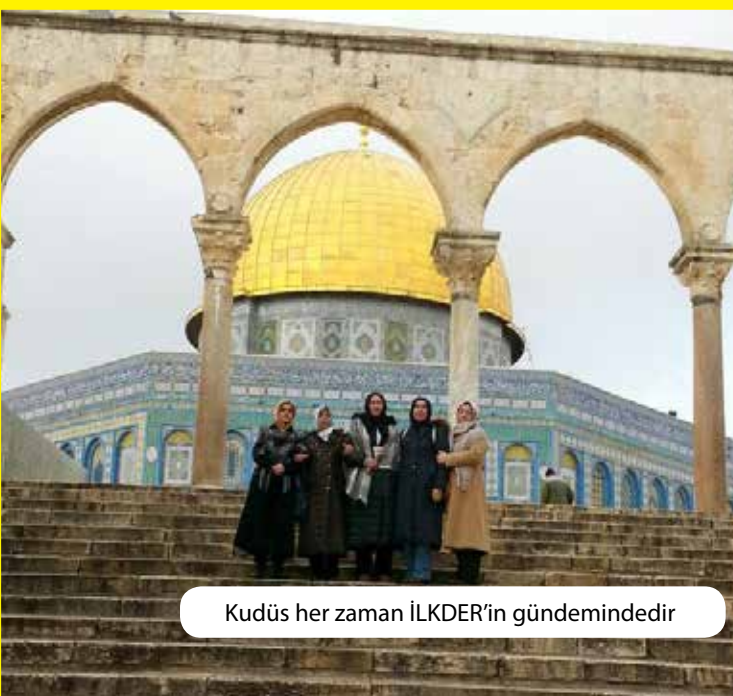
Kudüs her zaman İLKDER'in gündemindedir